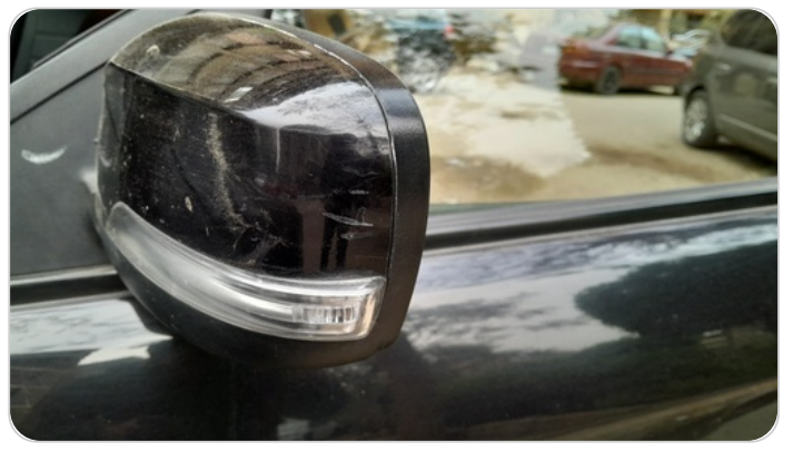
مرآة الباب الأمامي شمال : فبريكة (خرابيش)