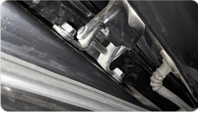
مفصلات ومسامير الباب الخلفي شمال : آثار فك وتركيب