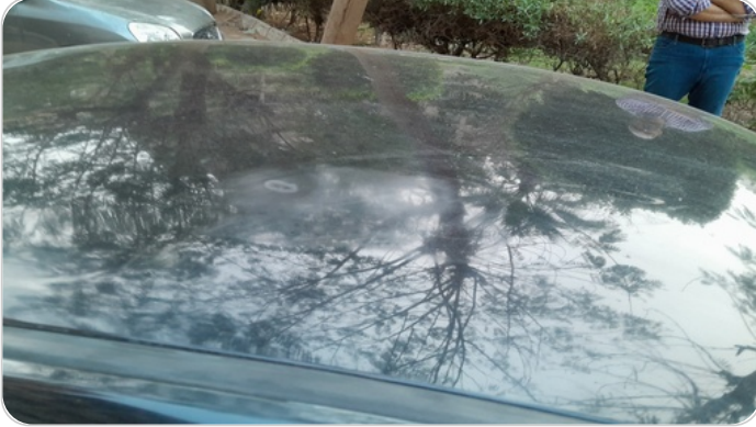
السقف : فبريكة ( الدهان متاكل )