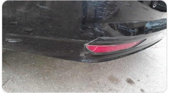
الاكصدام الخلفي : فبريكا (خرابيش)