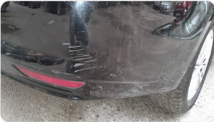
الاكصدام الخلفي : فبريكا (خرابيش)