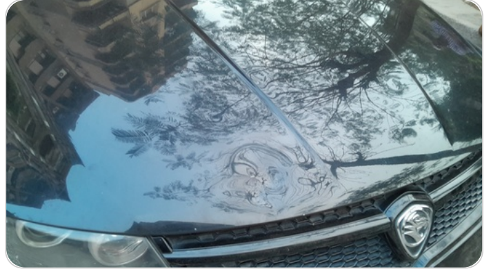
الكبوت : فبريكة (خبطات)