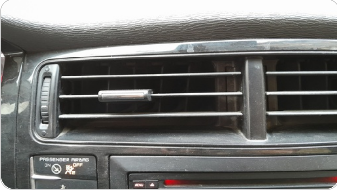
هوايات التكييف : كسر (هواية واحدة)