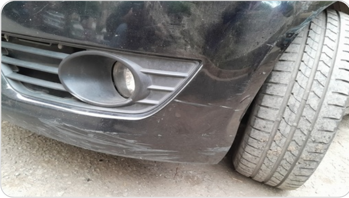
الاكصدام الامامي : فبريكا (خرابيش)