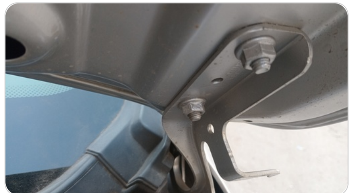
مفصلات ومسامير الكبوت : آثار فك وتركيب