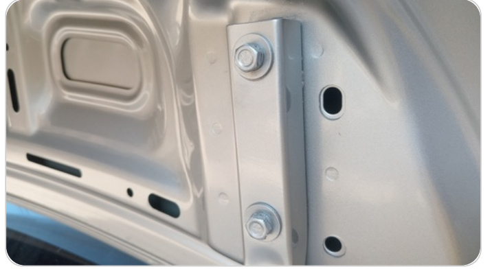
مفصلات ومسامير الشنطة : آثار تريبط