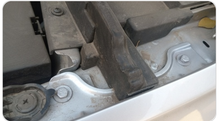
رفرف امامي شمال : آثار فك وتركيب