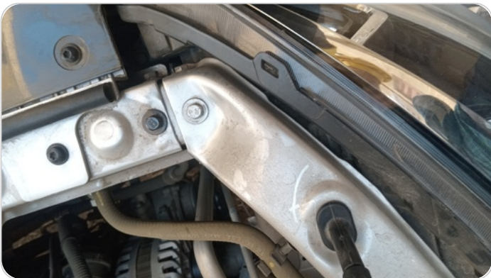
ستارة امامية علوية : آثار فك وتركيب