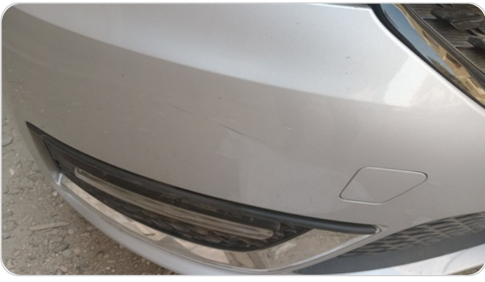
الاصدام الأمامي : فبريكة (خرابيش)