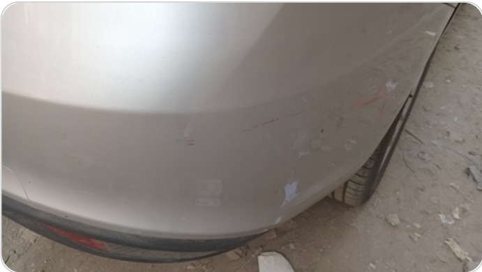
الاصدام الخلفي : فبريكة (خرابيش)