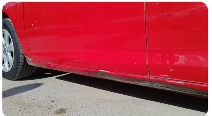
العتب السفلي شمال : فبريكة (خبطات)