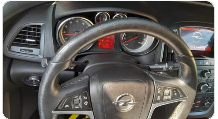
الطاره : متاكله