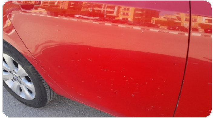
الباب الخلفي يمين : فبريكة (خرايبش)