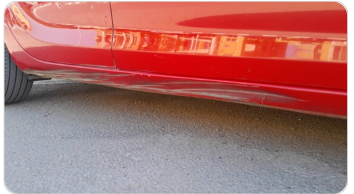
العتب السفلي يمين : فبريكة (خبطات)