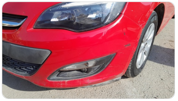
الاكصدام الأمامي : فبريكة (خرايبش)