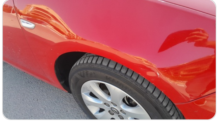
الرفرف الأمامي يمين : فبريكة (خرايبش)