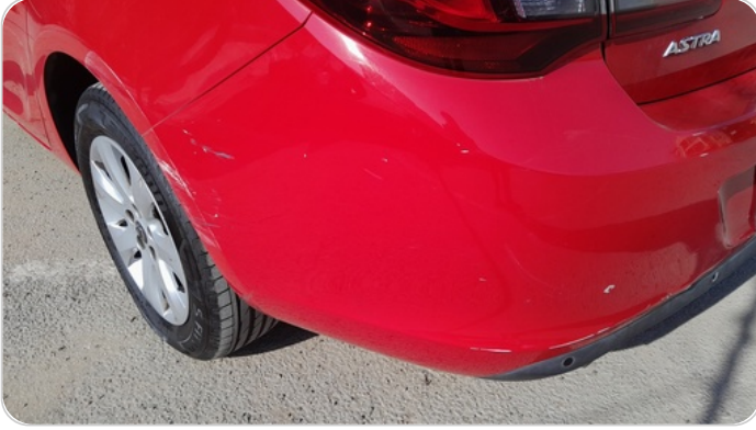
الاكصدام الخلفي : فبريكة (خرايبش)