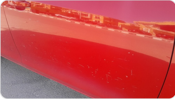
الباب الأمامي يمين : فبريكة (خرايبش)