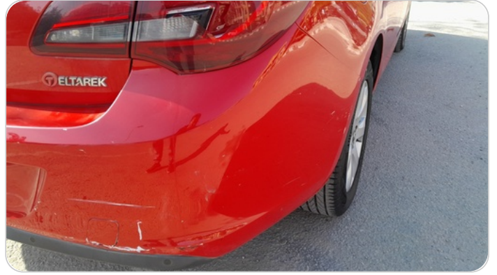
الاكصدام الخلفي :