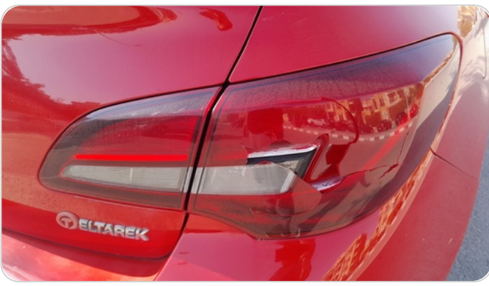
الكشاف الخلفي يمين : كسر بالباعة