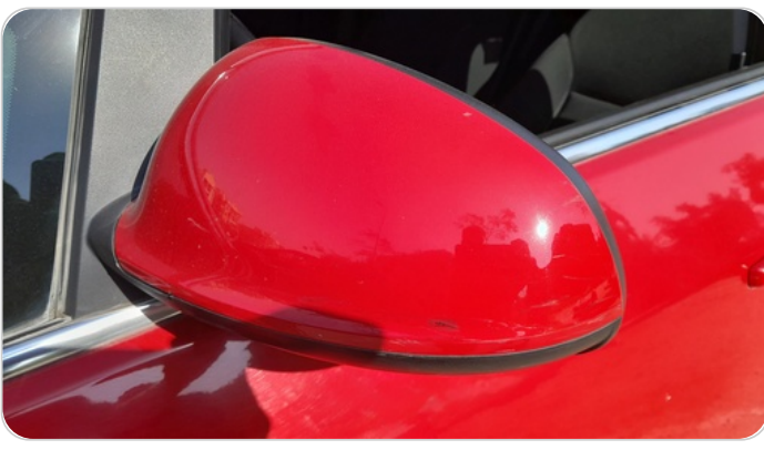
مراية الباب الأمامي شمال : فبريكة (خرايبش)