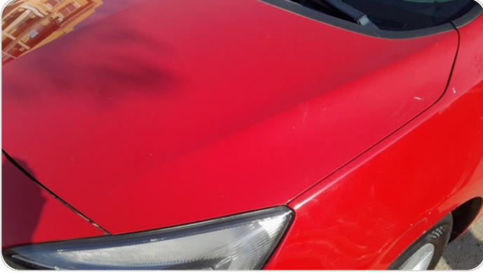
الكبوت : فبريكة (خرابيش)