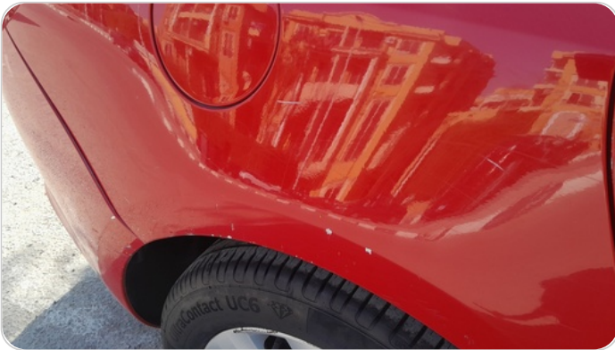
الرفرف الخلفي يمين : فبريكة (خرايبش)