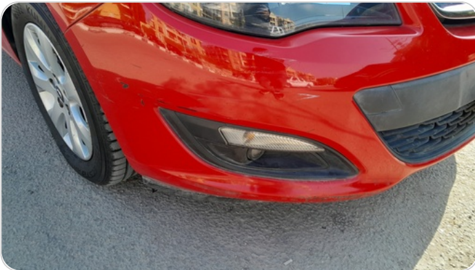
الاكصدام الامامي :