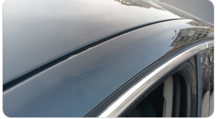
قائم خارجي أمامي شمال : فبريكة (الدهان متآكل)