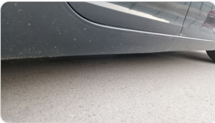
العتب السفلي يمين : فبريكة (خبطات)