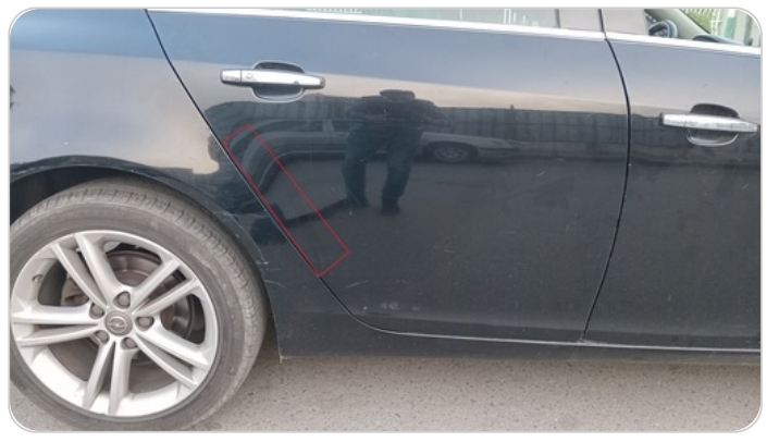
باب خلفي يمين : رش مع معجون جزئي