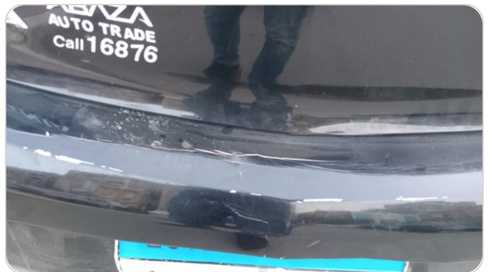
الاكصدام الخلفي : رش بدون معجون (خبطات)