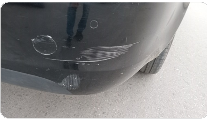
الاكصدام الخلفي : رش بدون معجون (خبطات)