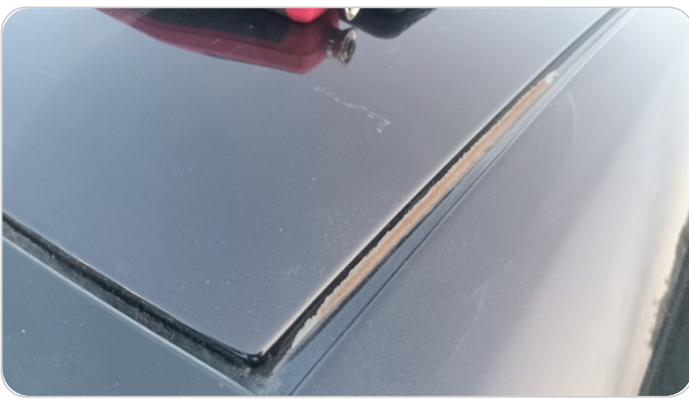
السقف : فبريكة (خرابيش - خبطات)