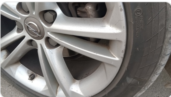
حالة الجنوط الخلفي : تجريحات بسيطه