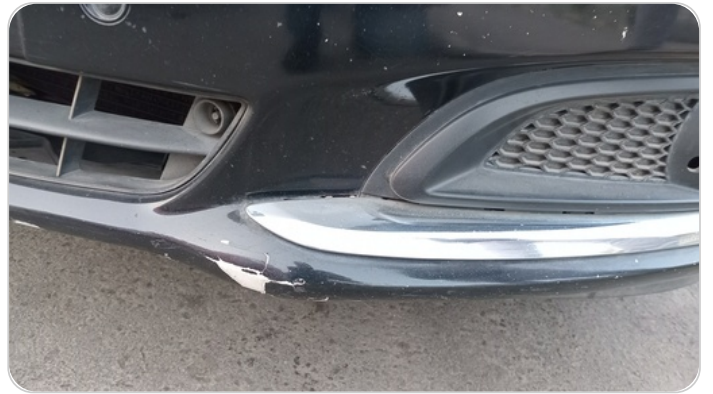
الاكصدام الامامي : رش مع معجون (خرابيش)