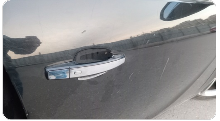
الباب الأمامي يمين : رش بدون معجون (خرابيش)