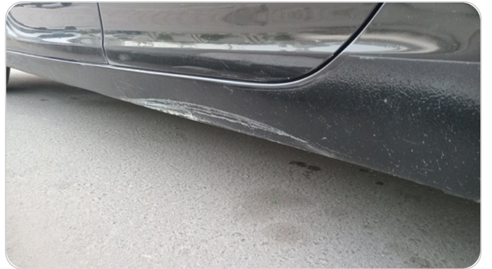
العتب السفلي شمال : رش مع معجون (خبطات)