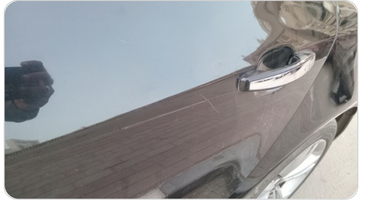
الباب الخلفي شمال : فبريكة (خرابيش - خبطات)