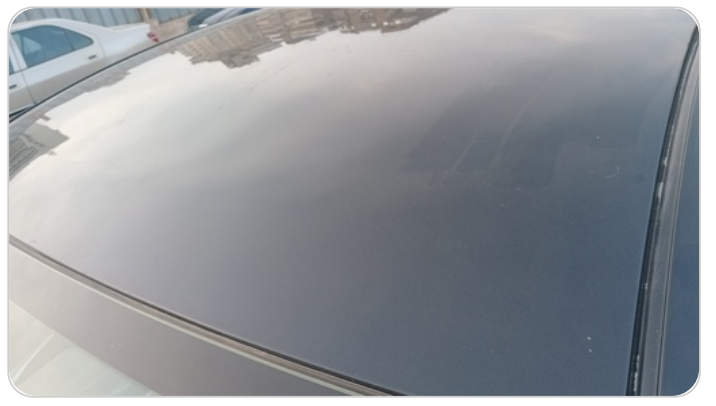
السقف : فبريكة (خرابيش - خبطات)