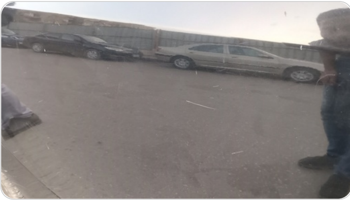
الباب الخلفي يمين : رش مع معجون (خرابيش)