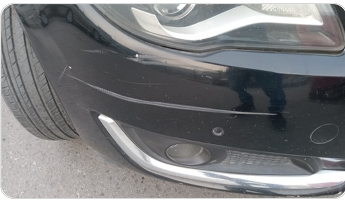
الاكصدام الأمامي : رش مع معجون (خرابيش)