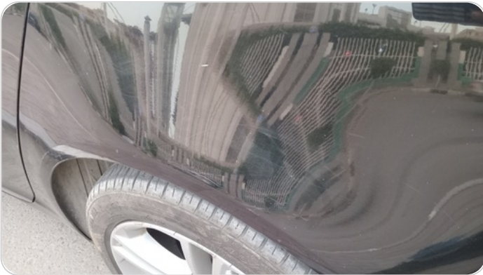
الرفرف الخلفي شمال : فبريكة (خرابيش - خبطات)