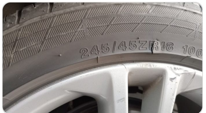
حالة الكاوتش الأمامي : تشققات/قطع بسيط