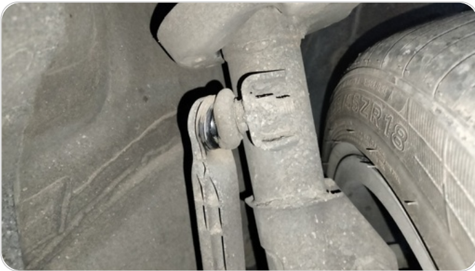
ذراع الميزان : تشققات (كاوتش الميزان)