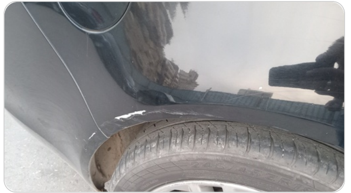
الرفرف الخلفي يمين : رش مع معجون (خرابيش)