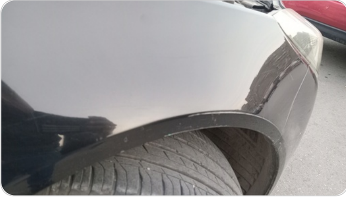
الرفرف الأمامي يمين : رش بدون معجون (خرابيش)