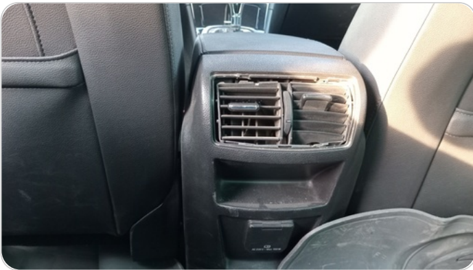
هوايات التكييف : كسر (هواية واحدة)