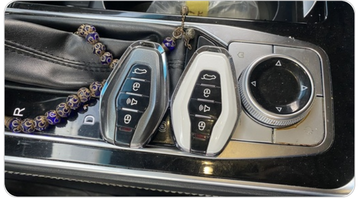
الريموت /المفتاح الاضافي : يعمل بكفاءة