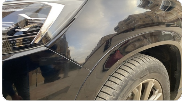
الرفراف الأمامي شمال : فبريكة (خرابيش)