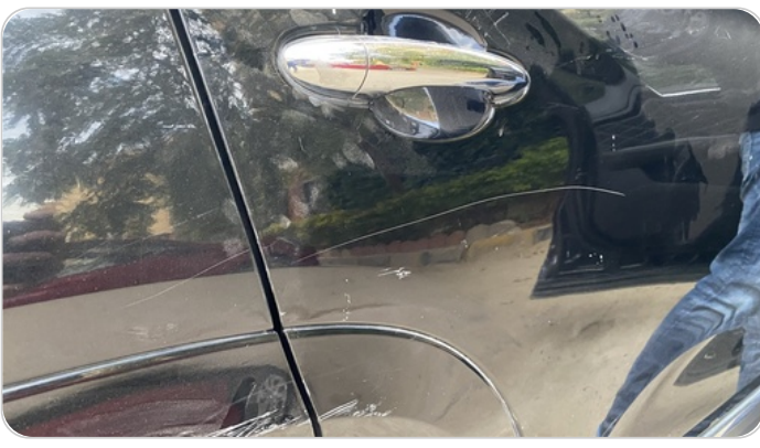
الباب الخلفي يمين : فبريكة (خرابيش)