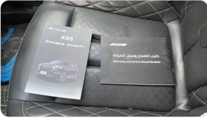
كتيب الضمان : موجود