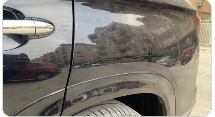
الرفراف الخلفي شمال : فبريكة (خرابيش)