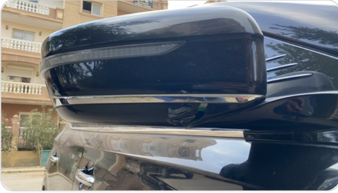
مراية الباب الأمامي يمين : كسر في الغطاء