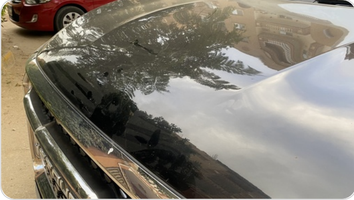
الكبوت : فبريكة (خرابيش)