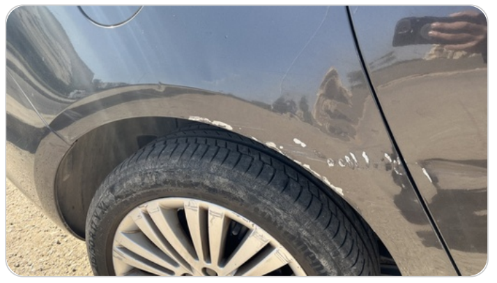
الرفرف الخلفي يمين : فبريكة (سمكره على البارد)