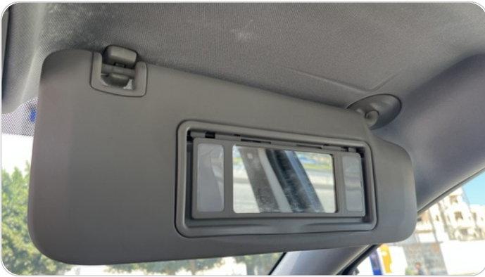
شماسات أمامية : تلف في اليمين