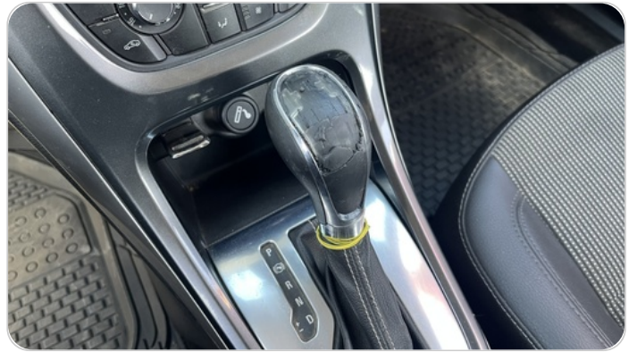
الكونسول الوسط : قطع / كسر / شرخ / تلف