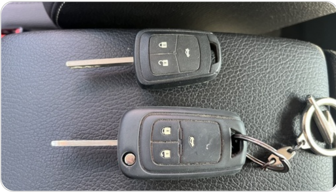
الريموت /المفتاح الاضافي : يعمل بكفاءة