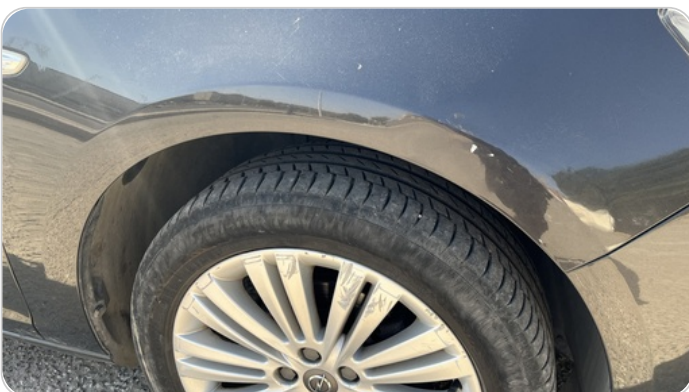
الرفرف الأمامي يمين : فبريكة (سمكره على البارد)