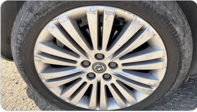
حالة الجنوط الخلفي : تجريحات بسيطه