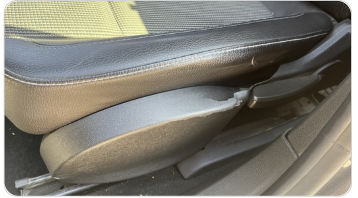
فرش كرسي أمامي شمال : قطع / كسر / شرخ / تلف