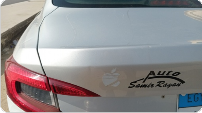
باب الشنطة : فبريكة (خرابيش)