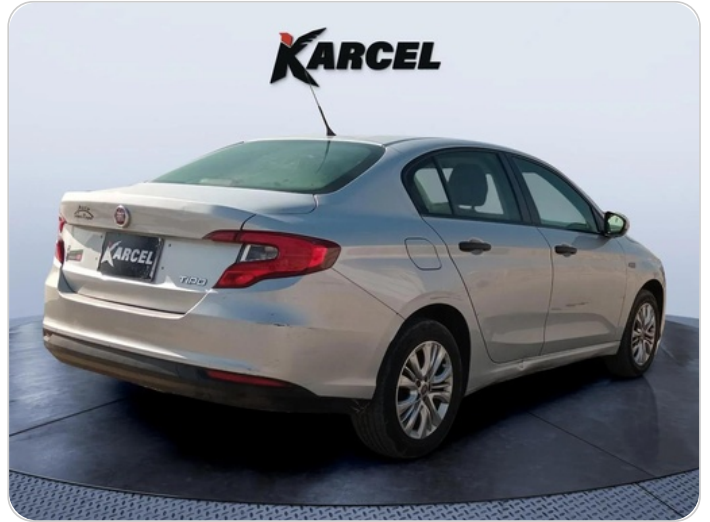
RR R 45