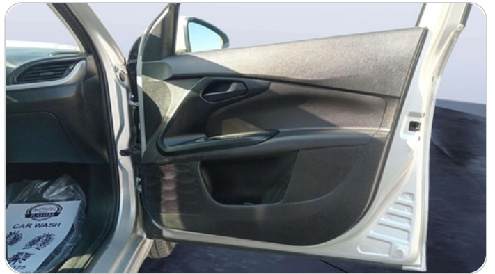
FR R DOOR