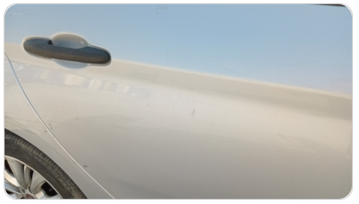
الباب الخلفي يمين : فبريكة (خرابيش)