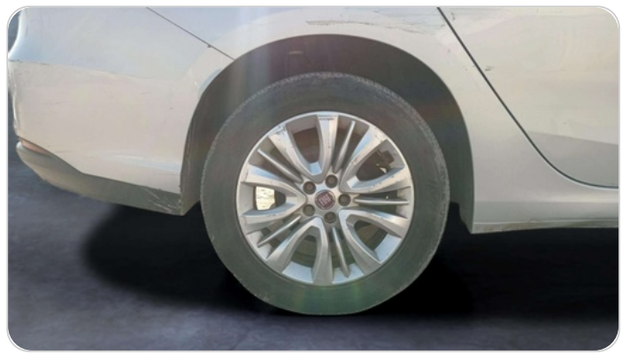
RR R TIRE