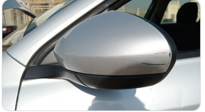
مرآة الباب الأمامي شمال : فبريكة (خرابيش)