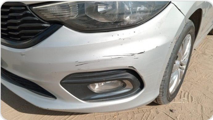
الكصدام الأمامي : فبريكة (خرابيش)