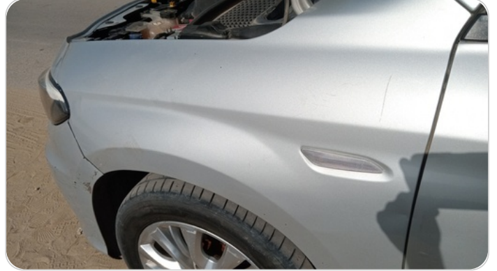
الرفرف الأمامي شمال : فبريكة (خرابيش)