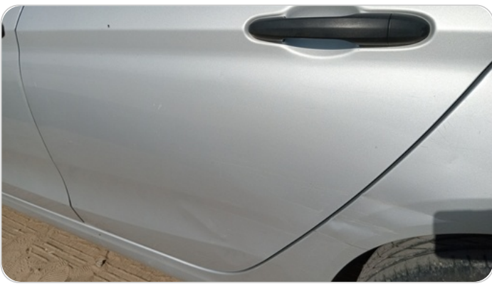
الباب الخلفي شمال : فبريكة (خرابيش - خبطات)