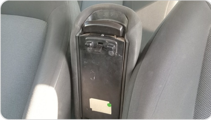
الكونسول الوسط : كسر