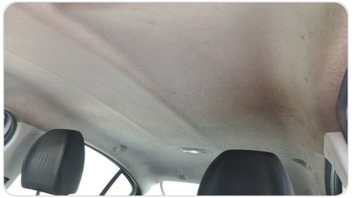
CAR ROOF MAT