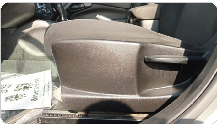
DRIVER SEAT SWITCHES