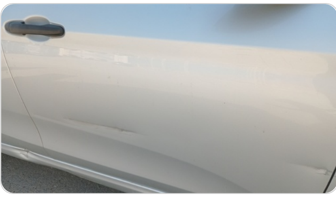
الباب الأمامي يمين : فبريكة (خرابيش - خبطات)