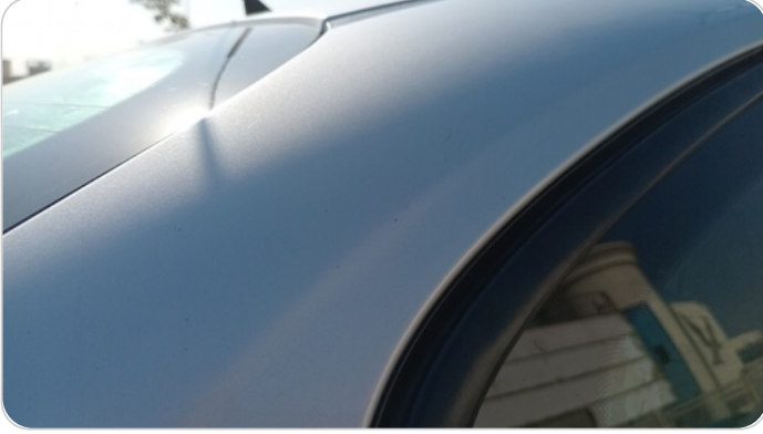
قائم خارجي خلفي يمين : فبريكة ( خرابيش )