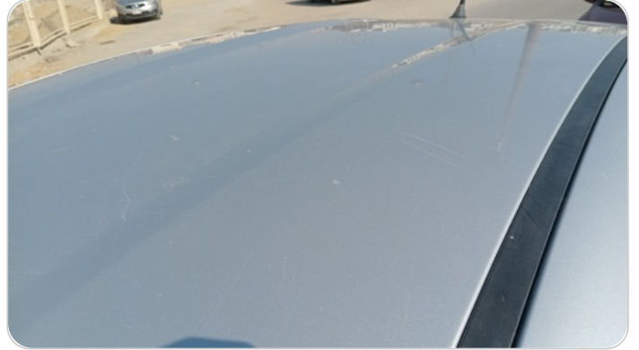
السقف : فبريكة (خرابيش)