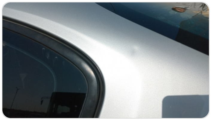
قائم خارجي خلفي شمال : فبريكة (خرابيش - خبطات)