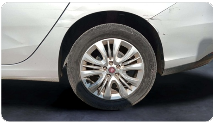
RR L TIRE