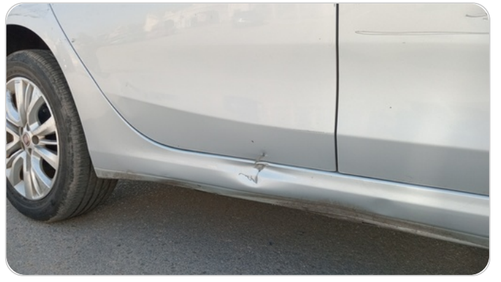
العتب السفلي يمين : فبريكة (خبطات)