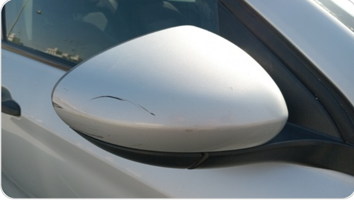
مراية الباب الأمامي يمين : فبريكة (خرايبش)