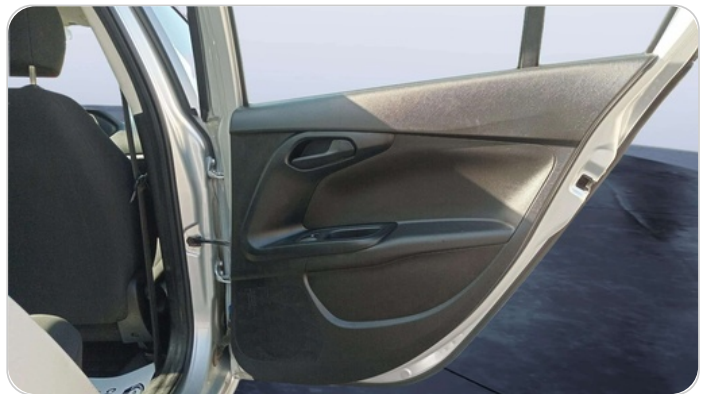
RR R DOOR