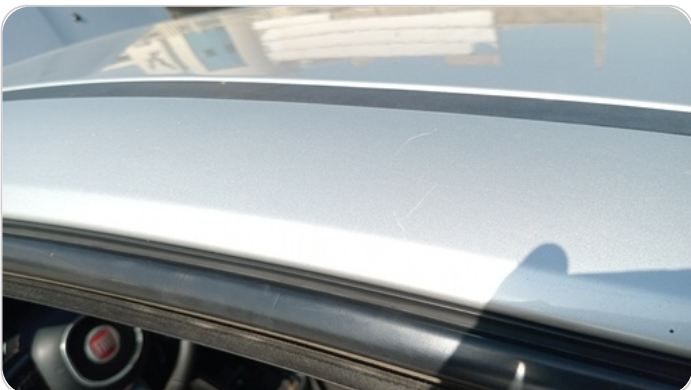
قائم خارجي أمامي شمال : فبريكة (خرابيش)