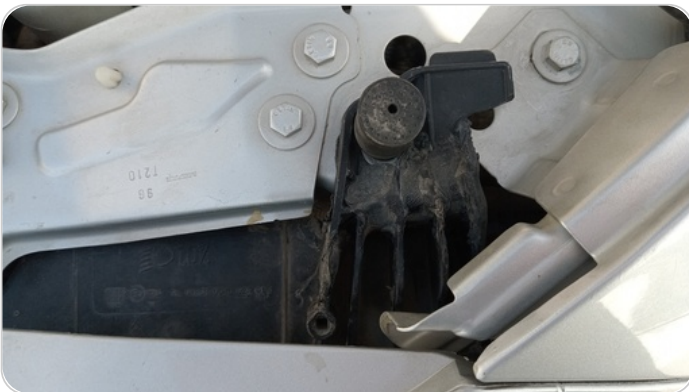
الكشاف الأمامي شمال : كسر في قواعد الكشاف