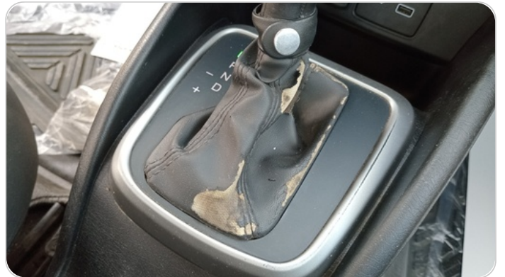
الكونسول الوسط : قطع /كسر/ شرخ /تلف