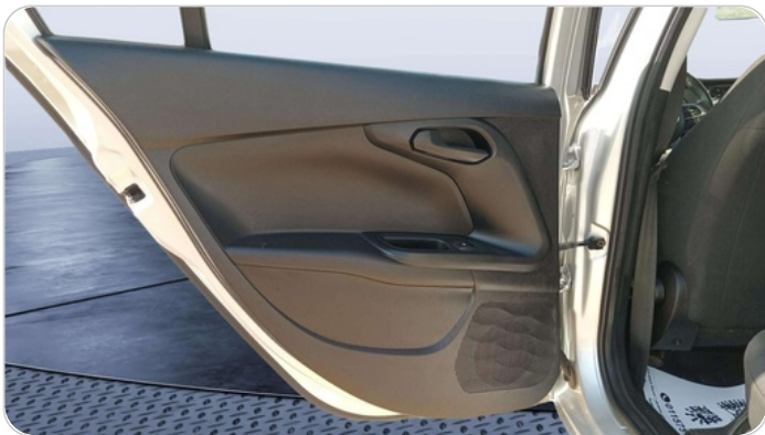
RR L DOOR