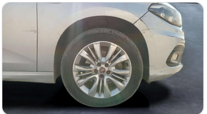
FR R TIRE