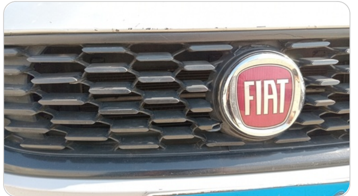
شبكة أمامية : شرخ / كسر