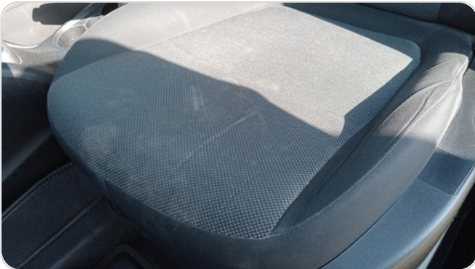
فريش كرسي أمامي شمال : قطع /كسر/ شرخ /تلف