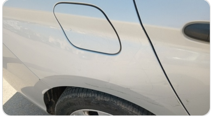
الرفرف الخلفي يمين : فبريكة (خرابيش)