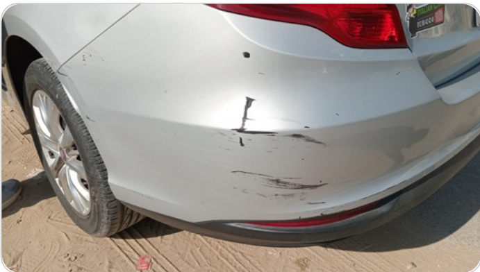
الكصدام الخلفي : فبريكة (خرابيش)