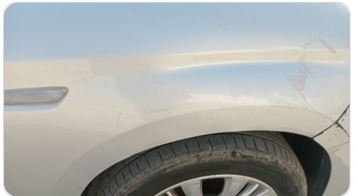
الرفرف الأمامي يمين : فبريكة (سمكره على البارد)