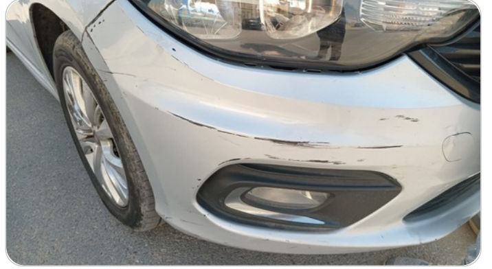
الاكصدام الامامي :