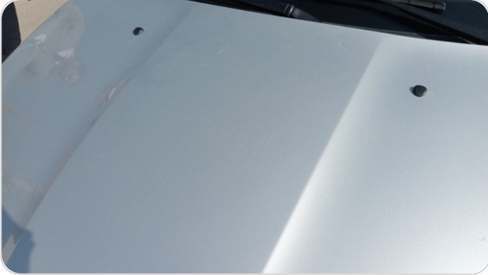
الكبوت : فبريكة (خرابيش)