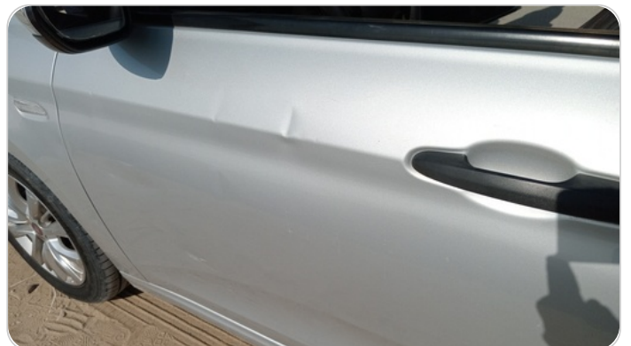
الباب الأمامي شمال : فبريكة (خرابيش - خبطات)