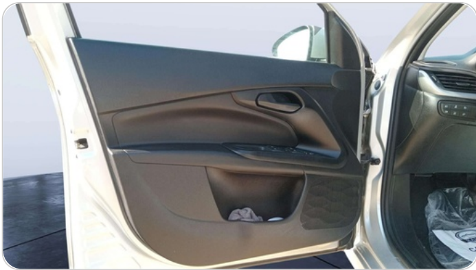
FR L DOOR