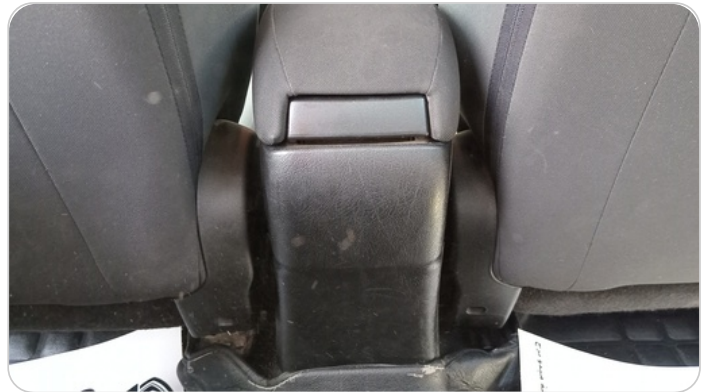
RR AC GRILL