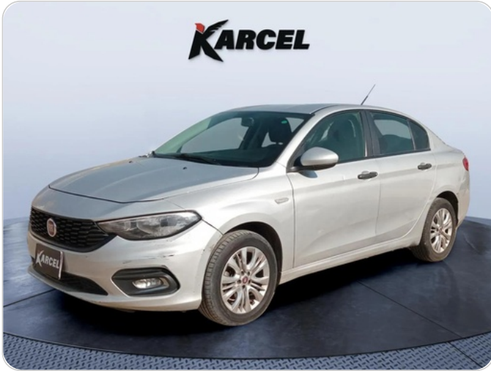
FR L 45