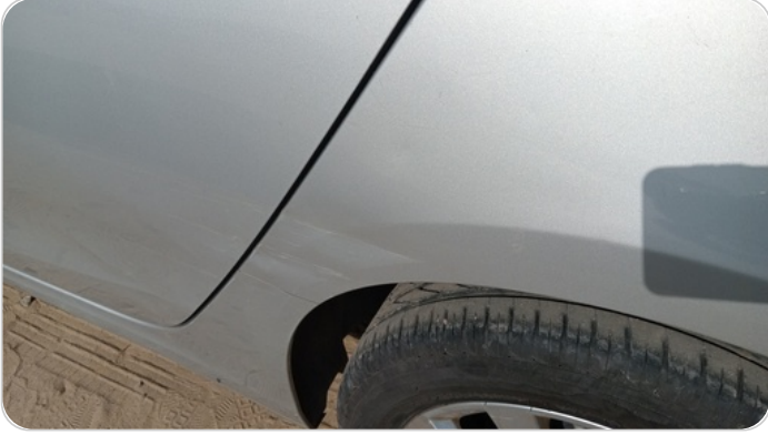
الرفرف الخلفي شمال : فبريكة (خرابيش - خبطات)