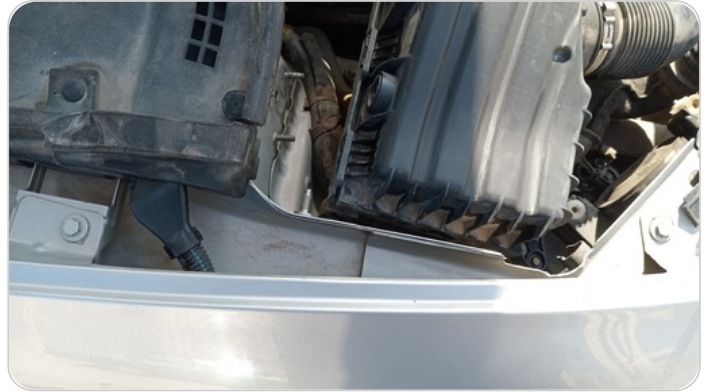
مسامير الرفرف الامامي يمين : اثار فك و تركيب