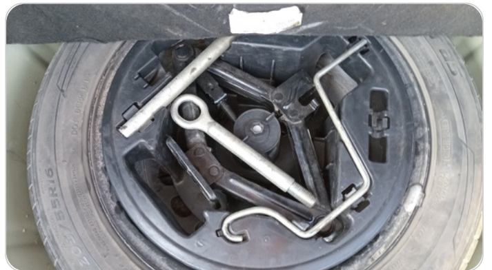
العدة وأدوات الأمان : متوفرة (بحالة جيدة)