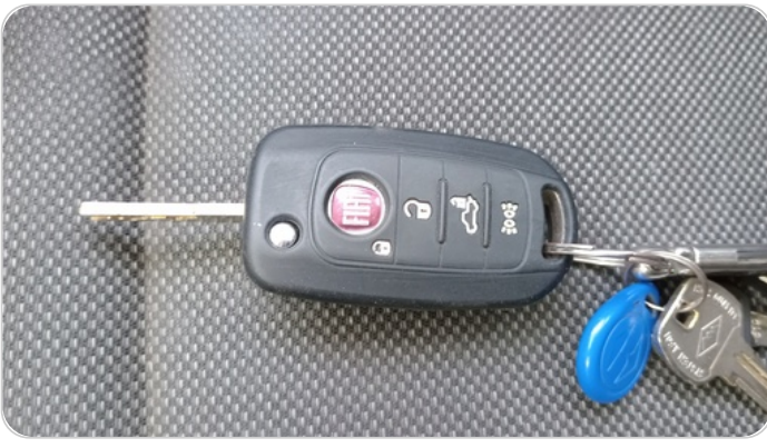
حالة الريموت / المفتاح : يعمل بكفاءة