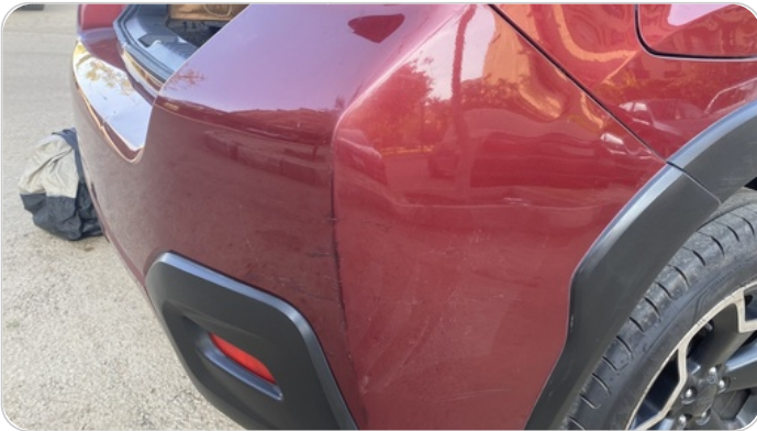
فبريكا خرابيش : الاكصدام الخلفي