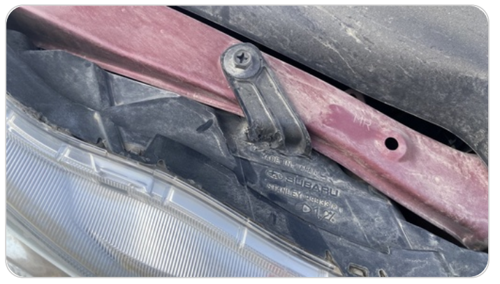
الكشاف الأمامي يمين : كسر في قواعد الكشاف