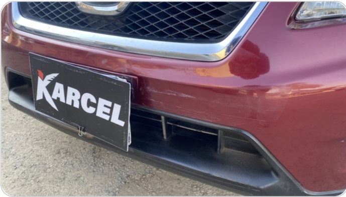
الاكصدام الأمامي : رش مع معجون (خرايش)