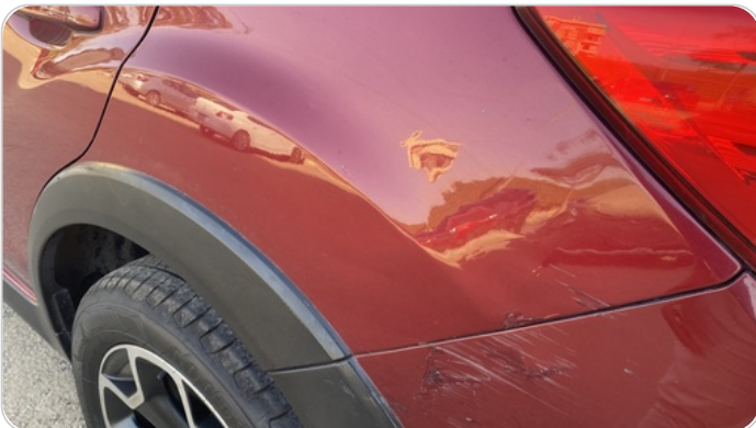
الرفرف الخلفي شمال : فبريكة (خرايش)