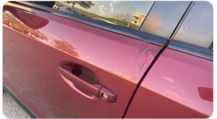
الباب الأمامي شمال : فبريكة (سمكره على البارد)