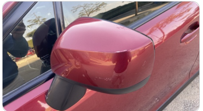
مراية الباب الأمامي شمال : فبريكة (خرايش)