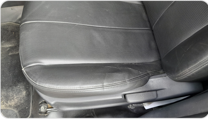
فرش كرسي أمامي شمال : قطع / كسر / شرخ / تلف