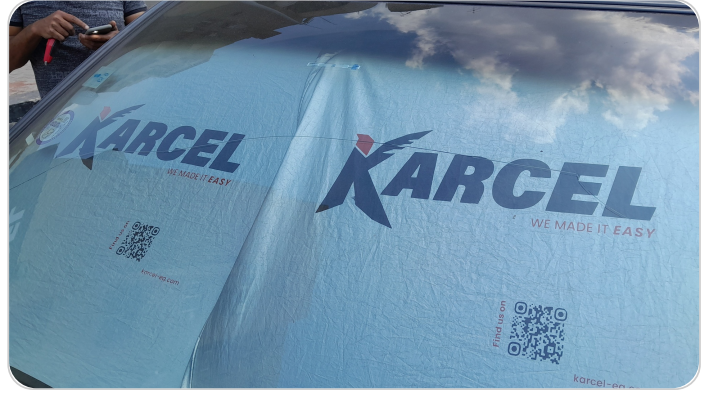
زجاج السيارة الأمامي : شروخ أو كسور