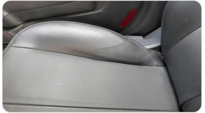
فرش كرسي أمامي يمين : قطع / كسر / شرخ / تلف