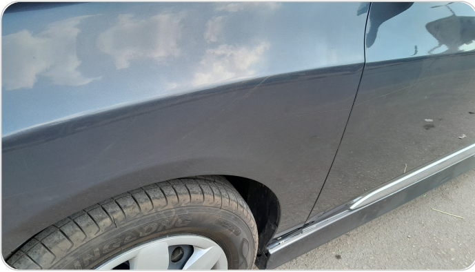
رفرف امامي شمال : فبريكة (خرابيش)