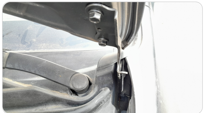
مفصلات ومسامير الكبوت : آثار فك وتركيب