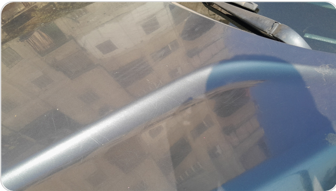
الكبوت : فبريكة (خرابيش)