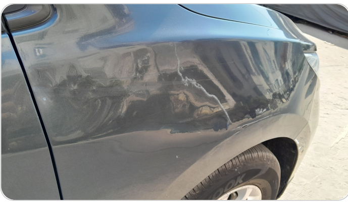
الرفرف الأمامي يمين : فبريكة (خرابيش)