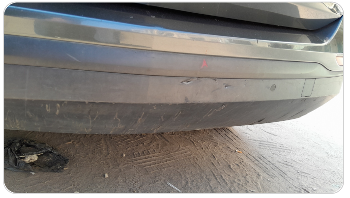
الاکصدام الخلفي : فبریکه (خرابیش)