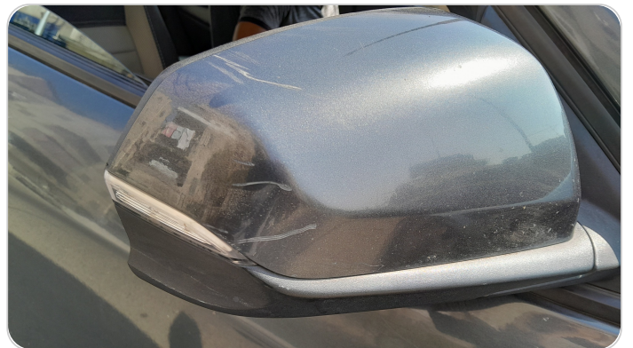
مراية الباب الأمامي يمين : فبريكة (خرابيش)