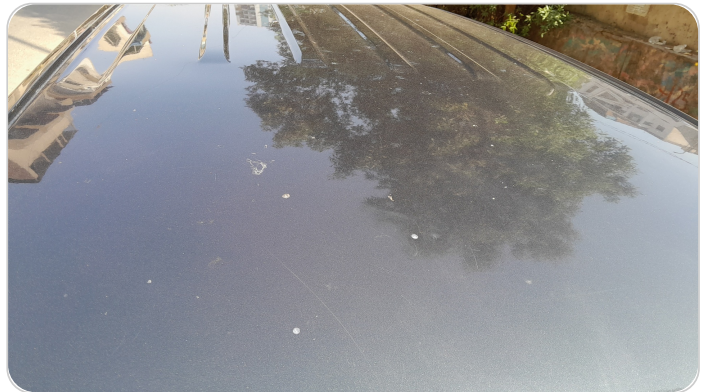
السقف : فبريكة (خرابيش)