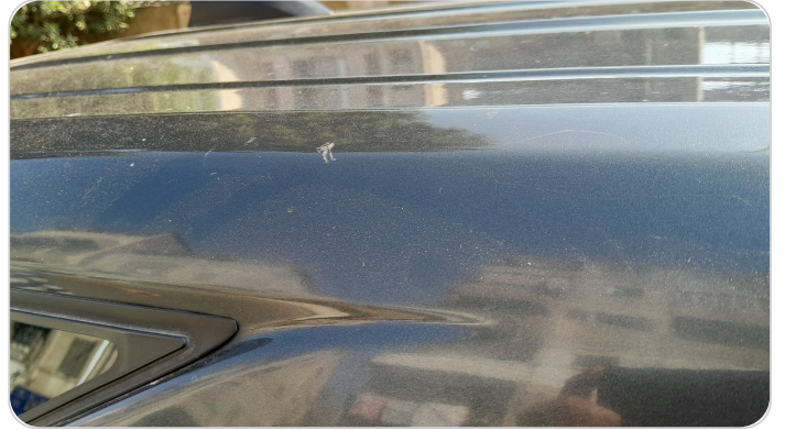
قائم خارجي خلفي يمين : فبريكة ( خرابيش )