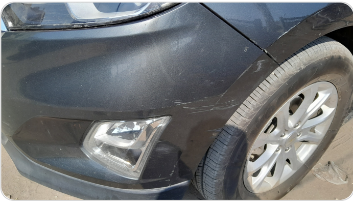
الاکصدام الامامي : فبریکه (خرابیش)