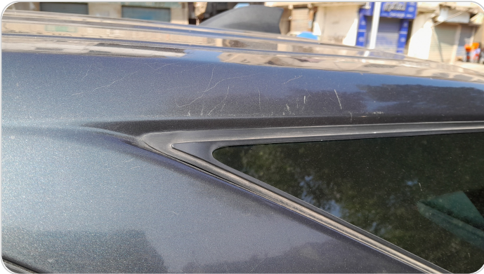
قائم خارجي خلفي شمال : فبريكة (خرابيش)