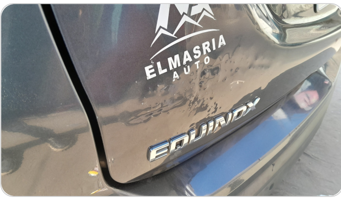
باب الشنطة : فبريكة (سمكره على الباردا)