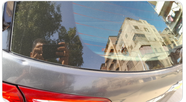
باب الشنطة : فبريكة (سمكره على البارد)