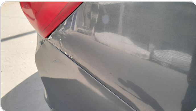
الرفرف الخلفي يمين : فبريكة (سمكره على البارد)