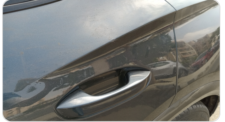
الباب الخلفي شمال : فبريكة (خرايش)