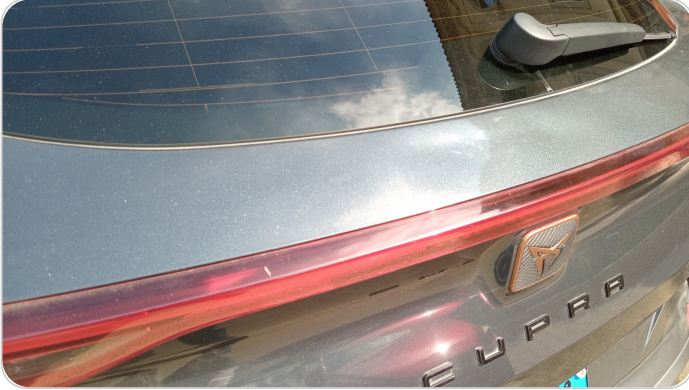
باب الشنطة : فبريكة (خبطات)