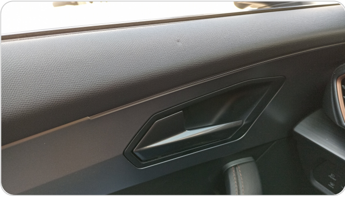
فرش الباب الأمامي شمال : قطع/كسر/شرخ/تلف