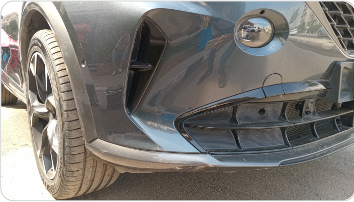
الاكصدام الأمامي : فبريكة (خبطات)